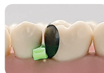
LumiContrast - matrice sectionnelle indiquée en cas de espaces interproximaux et de cavités standard