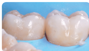
Vue latérale de la restauration avant la finition et le polissage illustrant la reconstruction morphologique précise assurée par les matrices QuickmatFIT

Le choix d'une matrice capable d'imiter ou de reproduire la morphologie et la courbure originales de la dent est la première étape d'une restauration esthétique et fonctionnelle réussie.