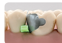
QuickmatFIT - matrice sectionnelle anatomique indiquée en cas de espaces interproximaux larges et de grandes cavités

Les QuickmatFIT sont des matrices sectionnelles anatomiques améliorées en acier inoxydable, disponibles en 0,04 mm d'épaisseur et en trois formes anatomiques pour tous les types de restaurations postérieures de classe II. Elles sont particulièrement indiquées pour les espaces interproximaux larges et les grandes cavités.