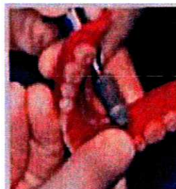
8 - Finissez à l'aide des fraises à finir fournies dans le coffret