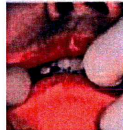
6 - Placez la prothèse en bouche et effectuez un enregistrement fonctionnel. Maintenir en place pendant 5mn.