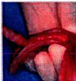
4 - Appliquez Sofreliner S ou M pendant 2mn à 23°C