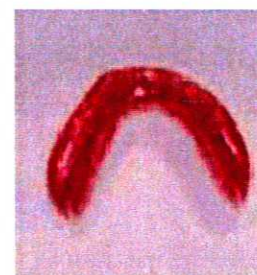
9 - Prothèse rebasée