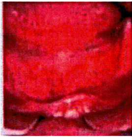
1 - Résorption et muqueuse fine