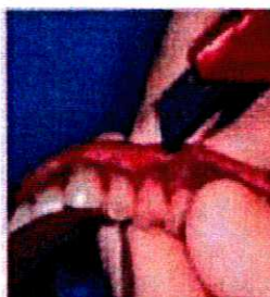
7 - Retirez les excès avec un instrument adapté