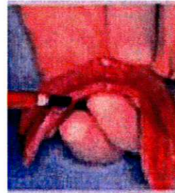
3 - Appliquez l'adhésif et séchez doucement