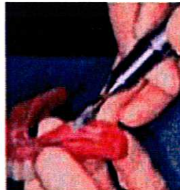
2 - Evidez la zone à rebaser