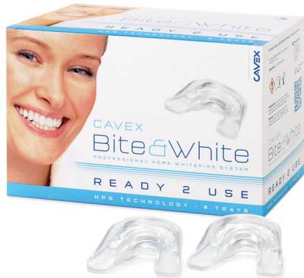
Cavex Bite&White Ready 2 Use (n° art BW031)