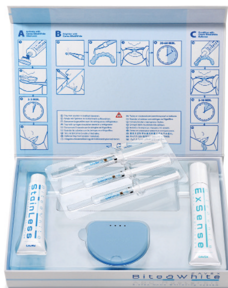
Cavex Bite&White ABC Masterkit (n° art BW090)

Commandez l'assortiment Cavex Bite&White auprès de votre dépôt.