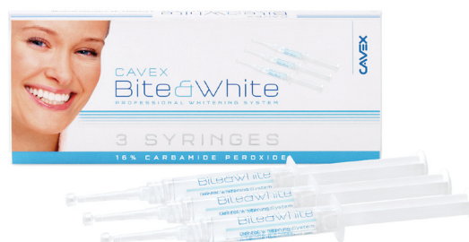
Cavex Bite&White 3 Syringes (n° art BW007)