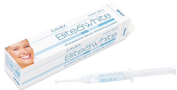
Cavex Bite&White Refill (recharge) (n° art BW010)