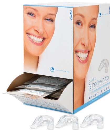
Cavex Bite&White Ready 2 Use Bulk (n° art BW036)