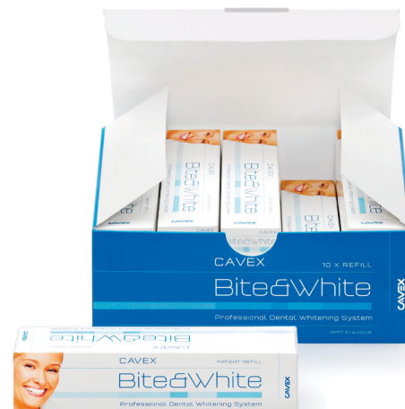
Cavex Bite&White Bulk Refill (recharge) (n° art BW015)