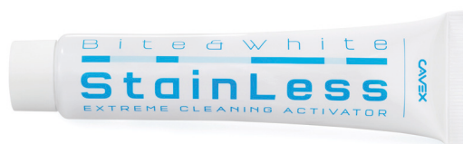
Cavex Bite&White StainLess (n° art BW070)