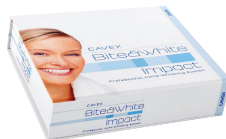
Cavex Bite&White Impact Kit (n° art BW040)